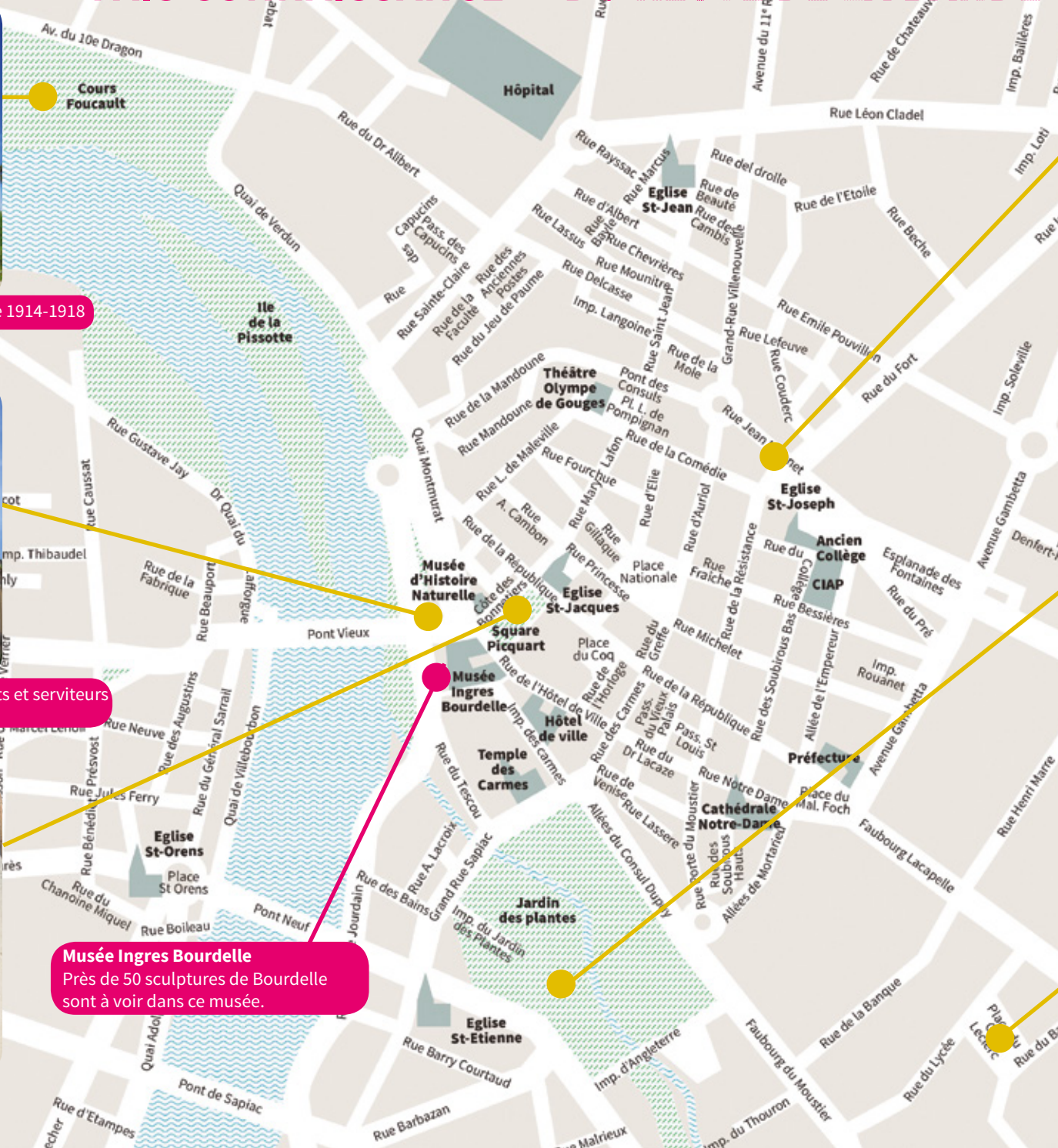
Musée Ingres Bourdelle Près de 50 sculptures de Bourdelle sont à voir dans ce musée.