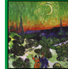
Promenade au clair de lune au milieu d'oliviers, Vincent Van Gogh, musée d'art de Sao Paulo, Bresil