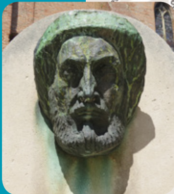
Autoportrait à 60 ans