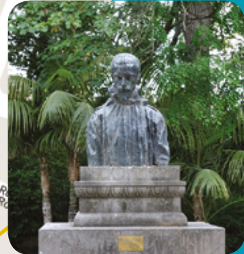
Buste d'Auguste Quercy