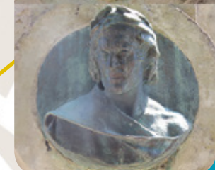
Bustes de Michelet et Arago