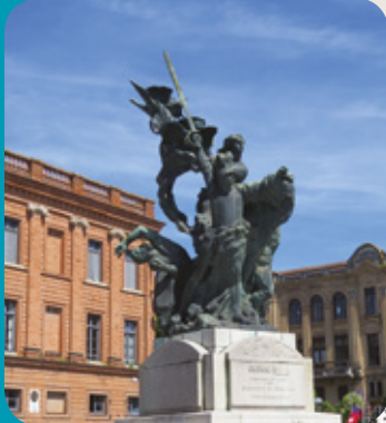
Hommage aux morts, combattants et serveurs du Tarn et Garonne, 1870-1871