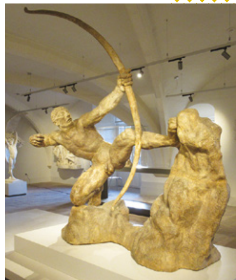
Musée Ingres Bourdelle, Montauban