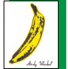
La banane du Velvet Underground Andy Warhol