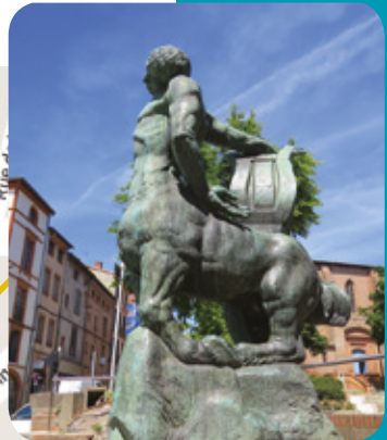
La Mort du dernier centaure