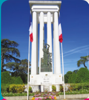
Monument aux morts de la guerre 1914-1918